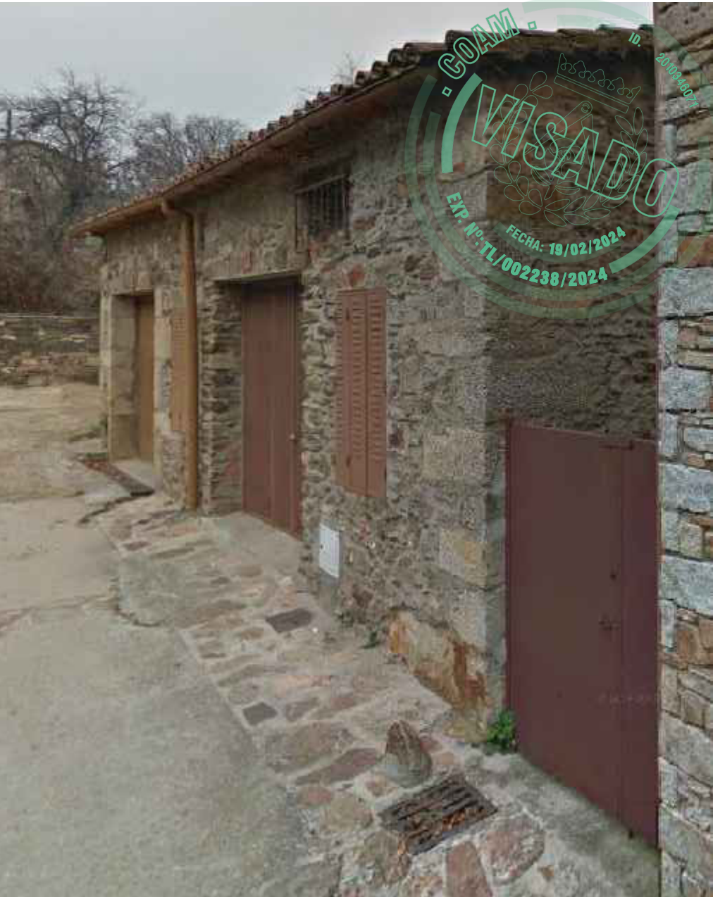
VISTA 1 C/DE LAS CRUCES