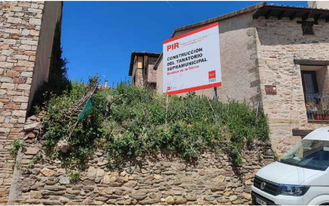
VISTA 3 C/DEL REAL