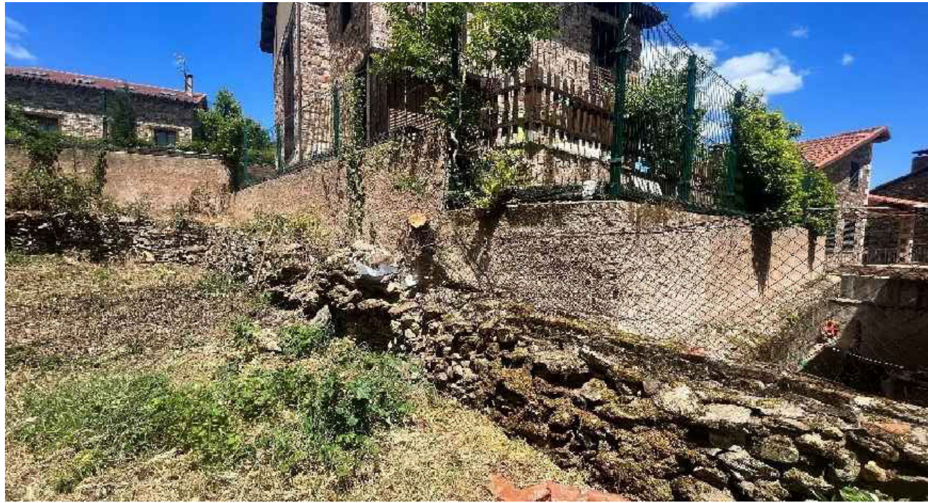
VISTA 4 DESDE EL INTERIOR