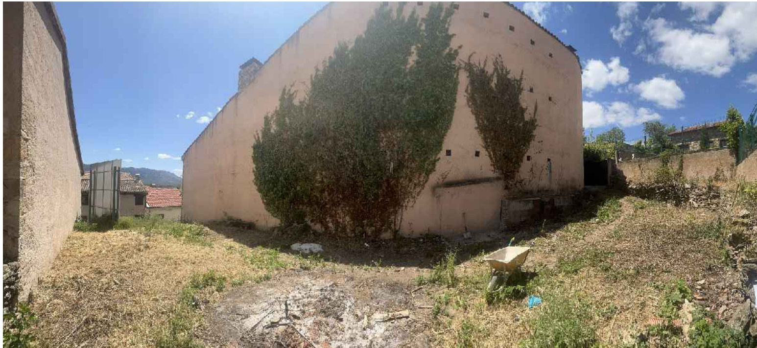
VISTA 2 DESDE EL INTERIOR